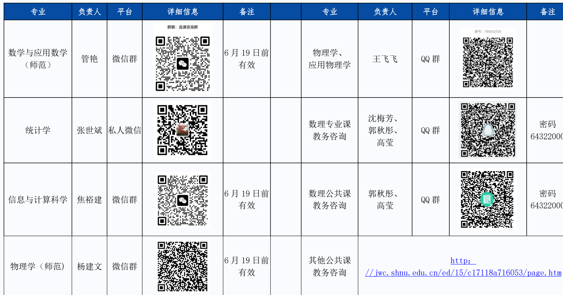
附件：数理学院各专业选课咨询方式