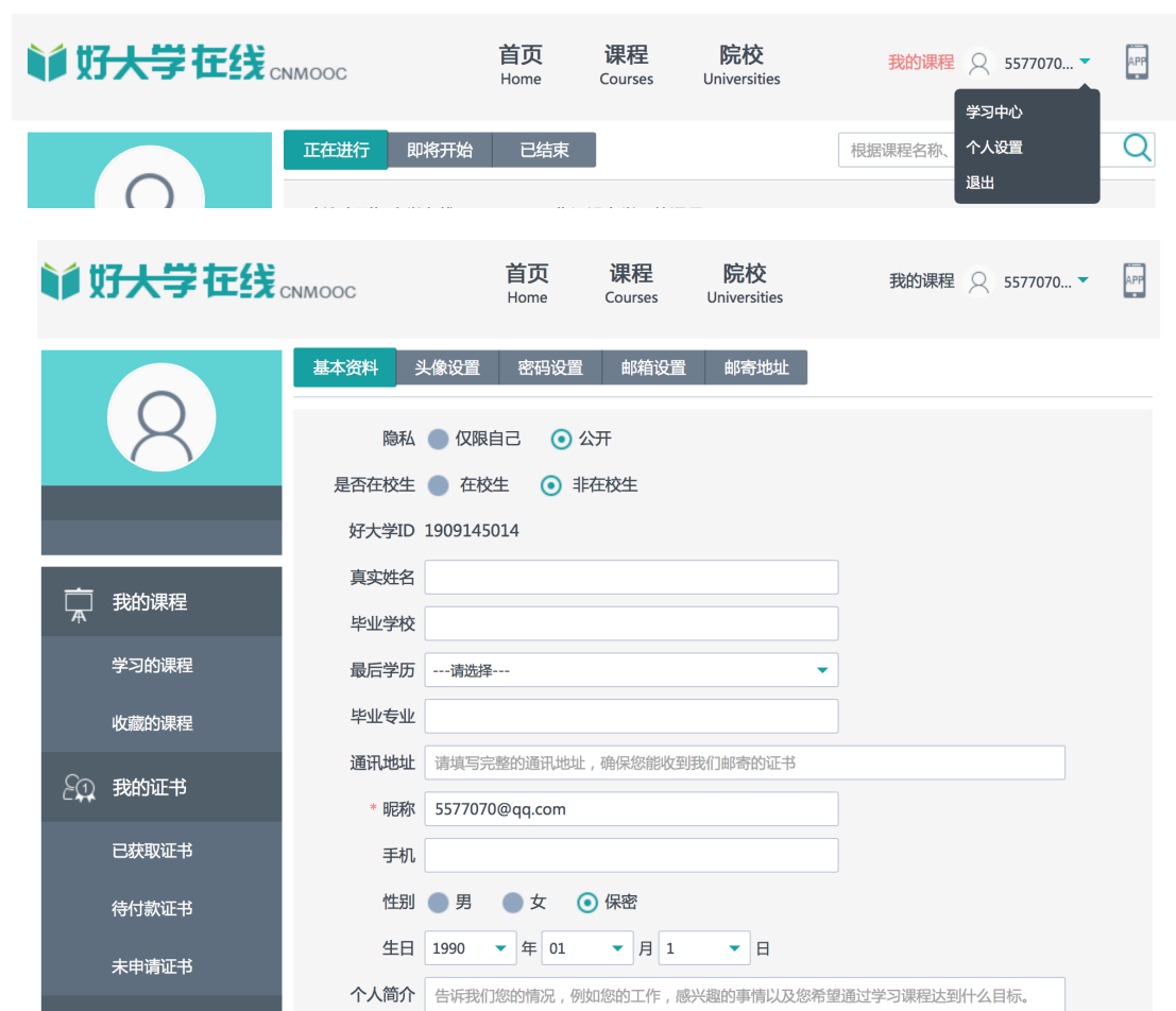
图 3 进入个人空间完善个人信息

4. Email 申请成为教师用户，请将您的用户信息（Email、姓名）发给我我们，我们为您升级为教师用户，您就可以开始建设课程了。Email 地址为 jbyu@qq.com ，成为教师用户后，您的个人栏目中将增加课程工作室选项。