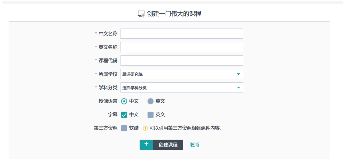
图 5 在课程库中创建一门课程

注意：这里创建的一门课程为课程库内的课程，课程代码不能重复，建议在创建时注意用课程的英文简写加流水号（CH001，表示中文基础课程）。