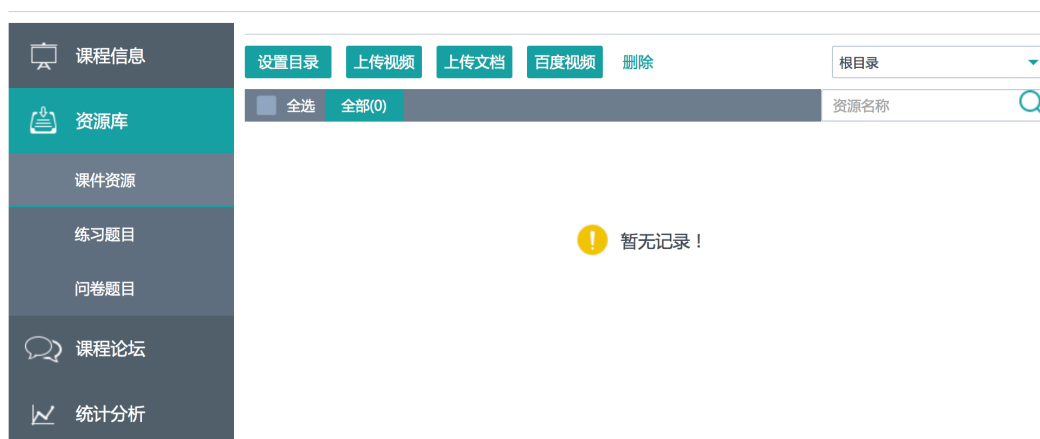
图 8 课程资源库在线建设