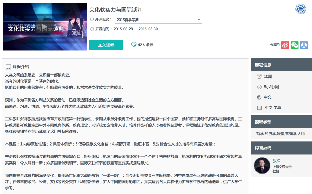
图 15 完整的课程信息

1. 完善课程相关信息：每一期开班的教学信息可能不一样，所以在课程开课时需要检查课程的开课信息：课程简介、课程大纲、考核标准，课程简介图片或片花，教学团队信息。因这些基础的课程信息作为课程的“名片”决定了学生是否选修这门课程。