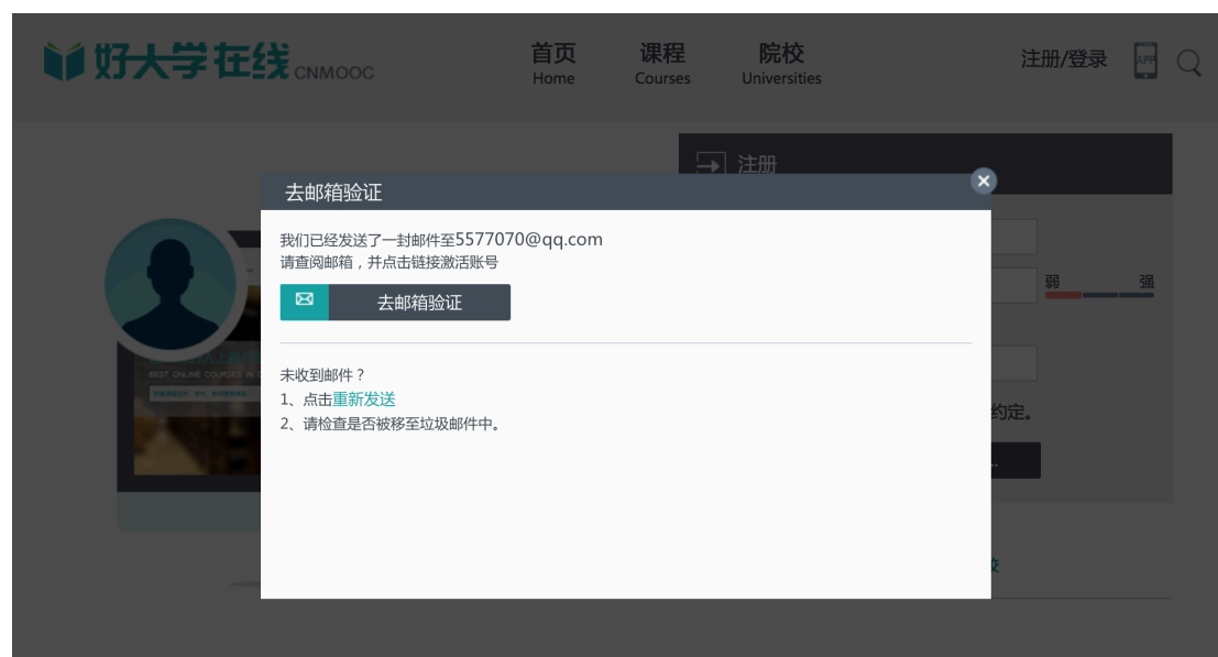
图 2 邮箱验证并激活账号