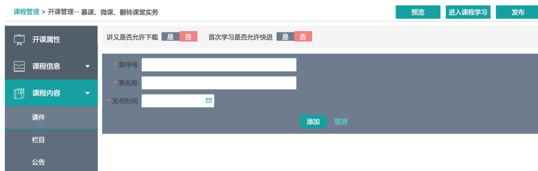
图 16 课程内容添加

2. 课程内容建设：课程基本信息完成后可以在课程内容栏目中完成课程内容的添加与发布。课程内容一般按周组织，也可以按章节组织，每一个模块设置一个发布时间。（经验告诉我们，慕课的学习时间为 10-20 小时，学习者每周投入慕课的时间为 1-2 小时，所以课程教学周为 8-12 周，内容按周发布，如表 2:慕课课程每周教学安排）。