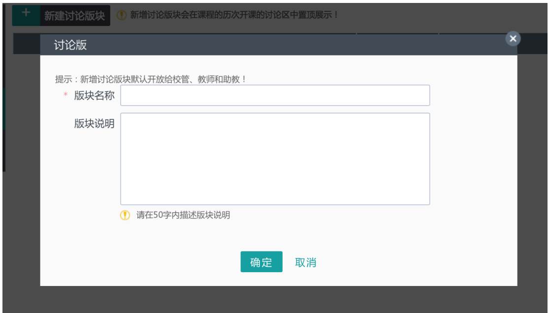
图 12 论坛板块设置