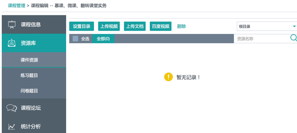
图 6 课程信息完善界面