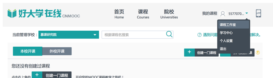
图 4 教师用户操作界面

4. Email 申请成为教师用户，请将您的用户信息（Email、姓名）发给我我们，我们为您升级为教师用户，您就可以开始建设课程了。Email 地址为 jbyu@qq.com ，成为教师用户后，您的个人栏目中将增加课程工作室选项。