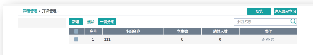
图 19 学生分组协助教师完成小组学习

进行分组，每组的同学可以由教师选择或导入，还可以为每个小组设置助教。这些助教将更好地完成教学相关的辅助工作。在多校选课时，分组显得额外重要，鼓励学生积极参加互动，同时又鼓励各校的校内翻转活动。