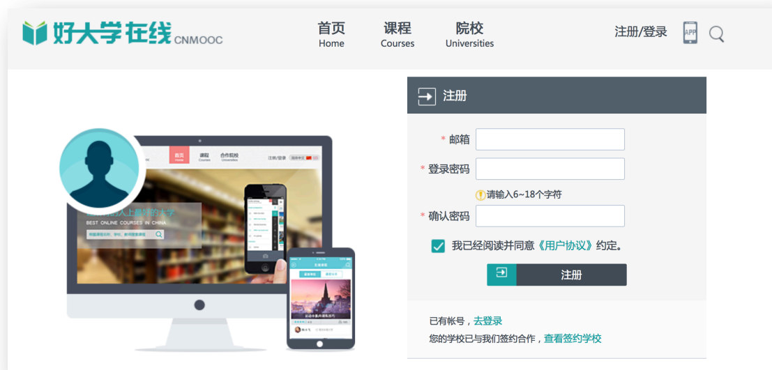
图 1 新用户注册