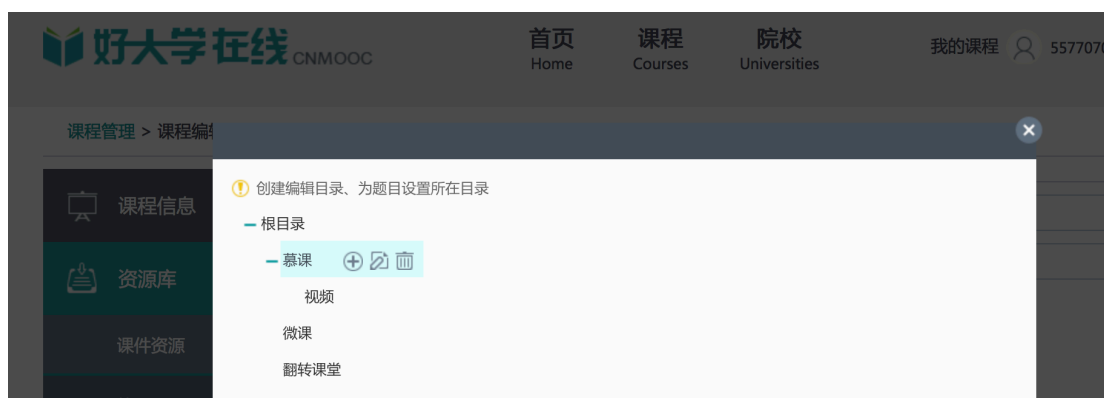
图 7 建立课程资源目录