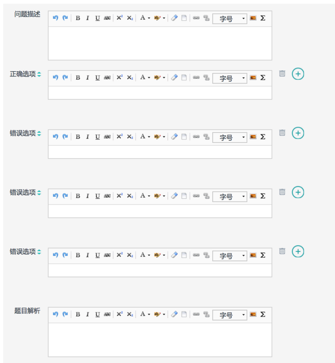
图 9 客观题添加