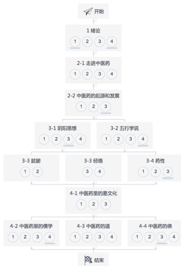
图 17 《中医药与中华传统文化》知识地图

3. 知识地图：完成课程内容后可以进一步完善课程的知识地图，知识地图将更好地引导学生学习。